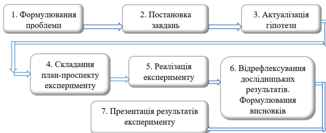
Рис. 1. Алгоритм розвитку дослідницької компетентності обдарованих студентів у процесі навчання фізики

З метою досягнення визначеного спектру дослідницьких завдань унаочнено алгоритм розвитку дослідницької компетентності обдарованих студентів у процесі навчання фізики крізь призму 7 основних позицій (рис. 1):