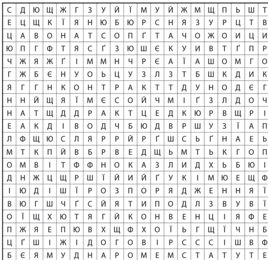
Рис. 2. Філворд, який розкриває жанри офіційно-ділового стилю

Упровадження інтерактивних ШІ-технологій у підготовку курсантів системи МВС має особливу стратегічну цінність. Здобувачі освіти, які вже є діючими працівниками поліції, щодня долають подвійне навантаження, поєднуючи службу з навчанням. В умовах постійних повітряних тривог і виснажливого перебування в укриттях рівень їхньої працездатності природно знижується. Використання гейміфікованих і високотехнологічних завдань стає дієвим інструментом «когнітивного перезавантаження»: це активізує увагу курсантів, підвищує їхню залученість і дозволяє ефективно засвоювати матеріал навіть у критичних психоемоційних умовах.