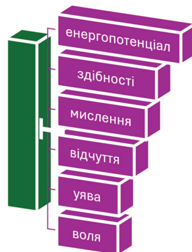
Рис. 2. Складники таланту за В. Моляко

Ґрунтуючись на дослідженнях науковців і послуговуючись власними науковими розвідками, підсумовуємо, що талант потребує постійного вдосконалення шляхом саморозвитку та практикування у творчій взаємодії дитини та дорослого. Вроджені задатки створюють основу, але без розвитку та практики вони можуть залишитися нереалізованими. Водночас, наполеглива праця без природної схильності теж може привести до високих результатів, хоч і потребуватиме більше зусиль.