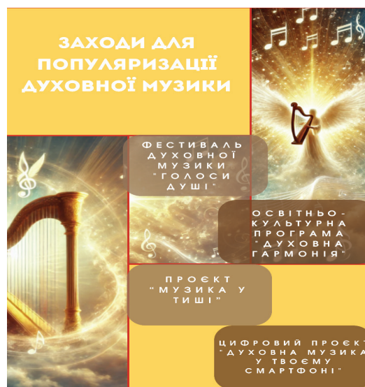
Рис. 2. Заходи для популяризації духовної музики серед молоді

У ході проведеної роботи нами було розроблено освітньо-культурну програму «Духовна гармонія», яка передбачає організацію серії лекцій, майстер-класів із вокалу та хорового співу, інтерактивних занять з історії духовної