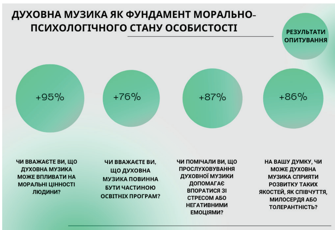
Рис. 4. Результати опитування здобувачів вищої освіти

Особливо важливою, на переконання здобувачів вищої освіти, є здатність духовної музики спонукати людей замислюватися над сенсом життя та власним призначенням, пробуджуючи тим самим потребу у самовдосконаленні та прагненні до вищих цінностей. Систематизація опрацьованих матеріалів дозволяє зробити висновок: духовна музика є важливим інструментом не лише для естетичного, але й для морального та психологічного розвитку особистості (рис. 4):