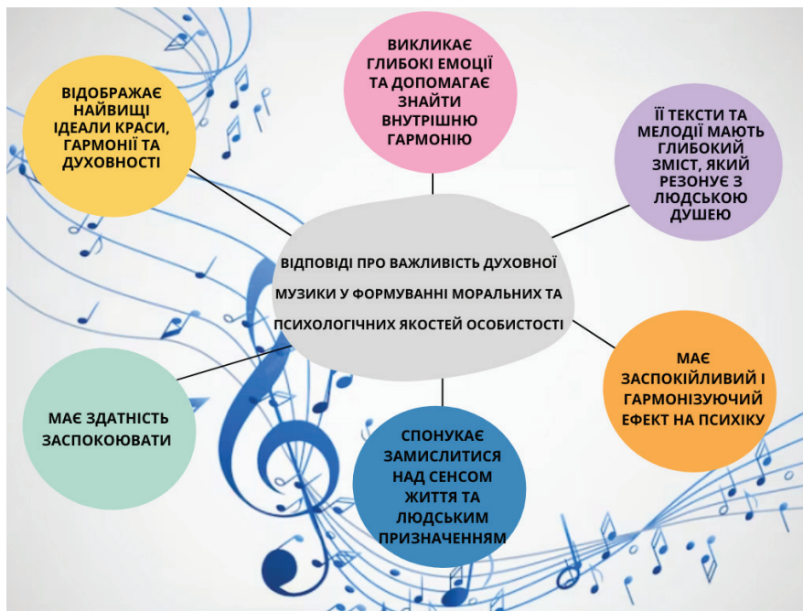
Рис. 3. Відповіді респондентів

Для кращого розуміння важливості духовної музики у формуванні морально-психологічних якостей особистості здобувачами вищої освіти Полтавського національного педагогічного університету імені В. Г. Короленка нами було проведено комплексне опитування, результати якого представлено на рис. 3: