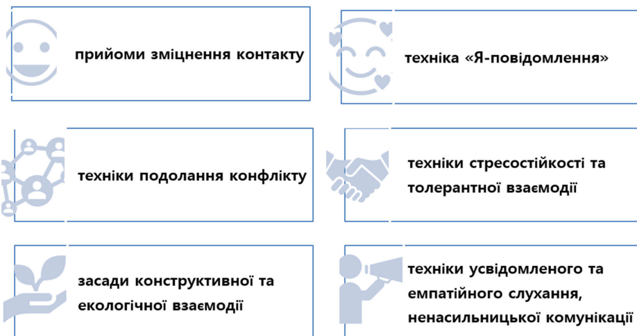
Рис. 2. Педагогічний інструментарій освітнього партнерства в ЗДО