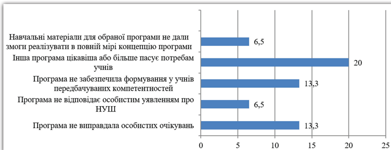
Рис. 2. Причини, за якими 60% учителів планують зміни у навчальних планах

До аналізу причин учителі підійшли, на нашу думку, досить критично і самокритично (рис. 2):