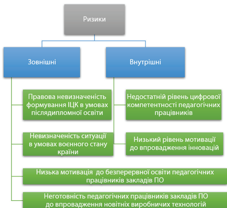
Рис. 1. Вплив зовнішніх і внутрішніх ризиків на рівень професійно-особистісного розвитку педагога

При виконанні педагогічного експерименту враховані зовнішні та внутрішні ризики, які можуть впливати на рівень професійно-особистісного розвитку педагога (рис. 1):