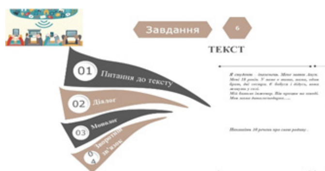
Мал. 6. Слайди презентації до завдання 6

Завдання 6. Спрямоване на розвиток навичок читання та розуміння прочитаного тексту, а також на розвиток усної комунікації. Студентам пропонується прочитати текст із журналу, зрозуміти його зміст і виконати завдання (поставити питання, скласти діалог, повторити текст у вигляді монологу). Це вимагає від них розуміння інструкцій, використання лексики та усного мовлення для обговорення дій і результатів, а також командної роботи. Такий підхід допомагає розвивати навички усного використання іноземної мови та розуміння тексту, а також сприяє активній комунікації між учасниками (мал. 6):