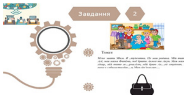
Мал. 2. Слайди презентації до завдання 2

Це завдання розвиває навички аудіювання, читання та розуміння тексту, а також сприяє узгодженню між визначенням інформації та її застосуванням у конкретному контексті (мал. 2):