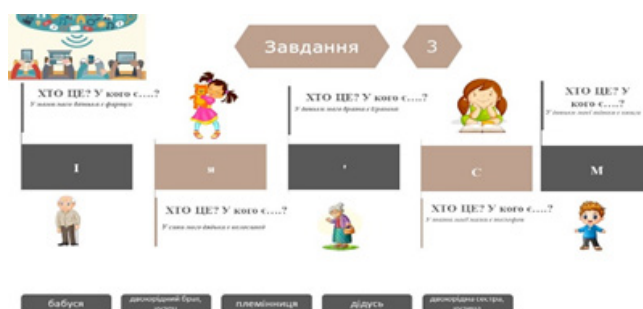
Мал. 3. Слайди презентації до завдання 3

Завдання 3. Завдання сприяє розвитку навичок розуміння лексики, логічного мислення та співпраці в групі. Студентам потрібно відповісти на запитання, розгадати загадку, щоб зібрати елементи пазла та розмістити їх у правильному порядку, щоб отримати слово-відгадку. Це вимагає від них використання активної лексики, побудови логічних зв'язків для пошуку правильної відповіді та співпраці у групі. Такий підхід сприяє розвитку навичок мовлення, розуміння іншомовного тексту та груповій комунікації (мал. 3):