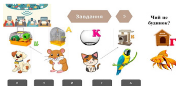
Мал. 5. Слайди презентації до завдання 5

отримують літери, з яких потрібно скласти ключове слово. Це завдання стимулює студентів до використання мовленнєвих навичок для спілкування та вирішення завдань і розвитку логічного мислення (мал. 5):