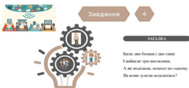
Мал. 4. Слайди презентації до завдання 4

Завдання 4. Розвиває навички логічного мислення, усної комунікації та обговорення відповідей у групі. Студентам потрібно обговорити можливі варіанти відповіді на загадку та прийти до спільного рішення. Вони також обговорюють тему родинних зв'язків, що сприяє розширенню лексичного запасу та розвитку навичок виразного мовлення. Крім того, завдання заохочує студентів активно використовувати мову для спілкування та співпраці в групі, що позитивно впливає на розвиток їх іншомовних комунікативних навичок (мал. 4):