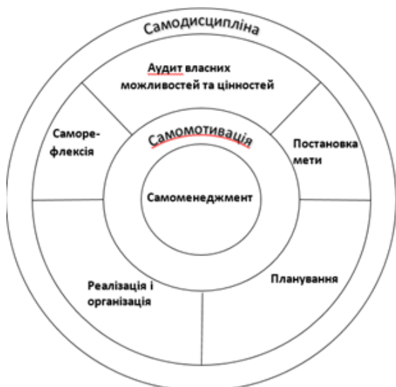
Рис. 2. «Колесо правил» (авторська розробка)