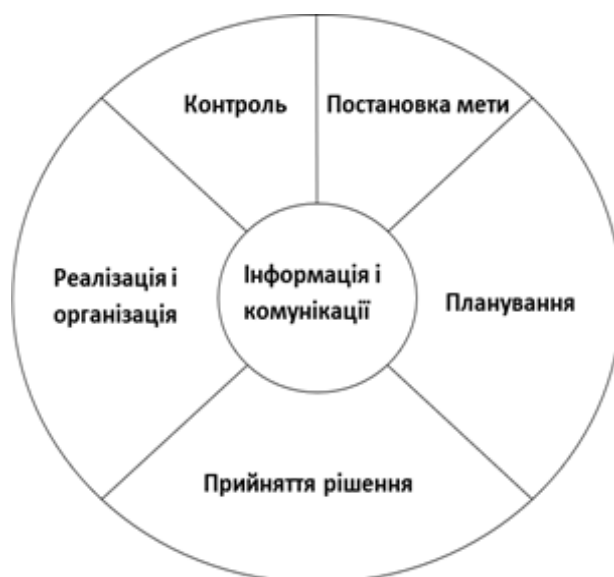
Рис.1. «Коло правил» Л. Зайверта

Ураховуючи «Коло правил» Л. Зайверта (рис. 1), пропонуємо адаптовану модель із включенням специфічних функцій самоменеджменту вчителя (рис. 2), серед яких: аудит власних можливостей і цінностей, самомотивація, самодисципліна, саморефлексія . Так, першочергово пропонується ввести функцію аудиту власних можливостей та цінностей . Відповідно до Л. Зайверта цілепокладання (постановка мети) передбачає попередній аналіз професійного здобутку вчителя. Проте цей етап, враховуючи механізми його проведення і питомих значення для всієї подальшої роботи, вважаємо потрібно виділити в окрему функцію і дати його ґрунтовну характеристику. Термін «аудит» походить від латинського слова «audire» – слухати і чути. Слухання є одним із найважливіших завдань аудитора.