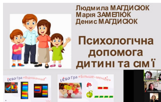
Рис. 2. Приклад вебінара у «Віртуальній педагогічній студії»

У вкладці «Конференції» Віртуальної педагогічної студії (рис. 2) керівники ЗДО мають можливість у режимі онлайн-конференції брати особисту участь у регулярних педагогічних вебінарах і майстер-класах щодо налагодження успішного спілкування з вихователями, впровадження інноваційних педагогічних технологій у ЗДО (наприклад, технік «ігрова терапія», «метафоричні карти», «арттерапія»), застосування в управлінській діяльності сучасних засобів ІКТ (ZOOM, Google Classroom, хмаро орієнтованих технологій, цифрових ресурсів тощо).