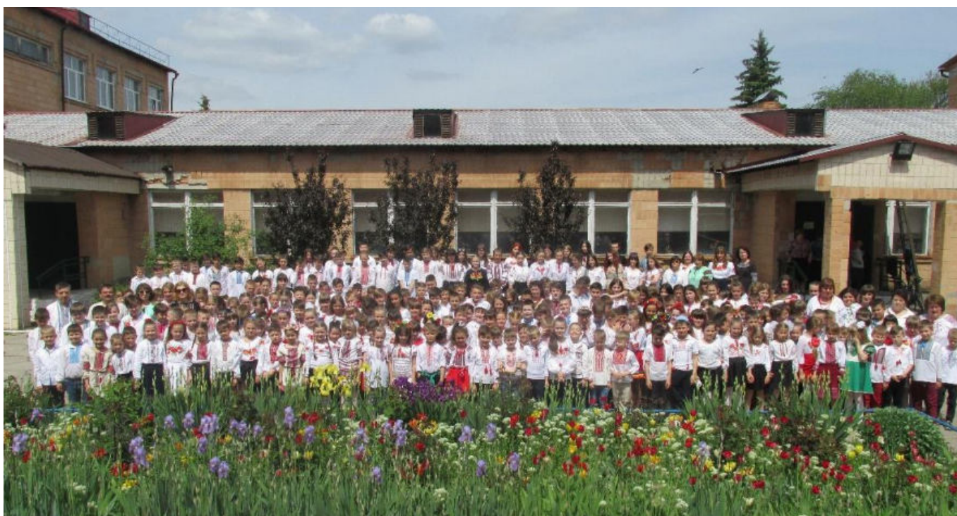
Фото 1. Свято вишиванки в Хорольській гімназії-родині