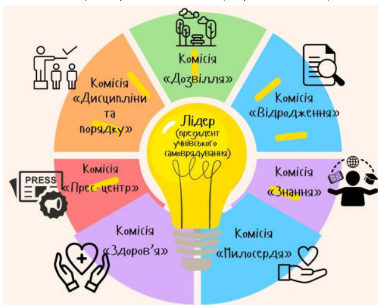
Рис. 1. Схема учнівського самоврядування «Лідер»

2. Клас під відкритим небом «Екомістечко»: встановлено альтанку з лавками-трансформерами та фліпчартом для організації комфортної зони відпочинку та навчання в зеленій зоні подвір'я, що сприяє формуванню екологічної свідомості, дбайливого ставлення до навколишнього середовища, розвитку фантазії, креативного мислення,