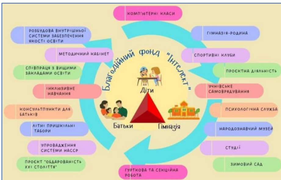
Рис. 2. Схема благодійного фонду «Інтелект»

Сім'я для дитини є середовищем, у якому формується особистість. У залежності від атмосфери в сім'ї, характеру родинних стосунків, освітнього рівня, професії батьків, їхнього життєвого досвіду, знання педагогіки сімейного виховання розви-