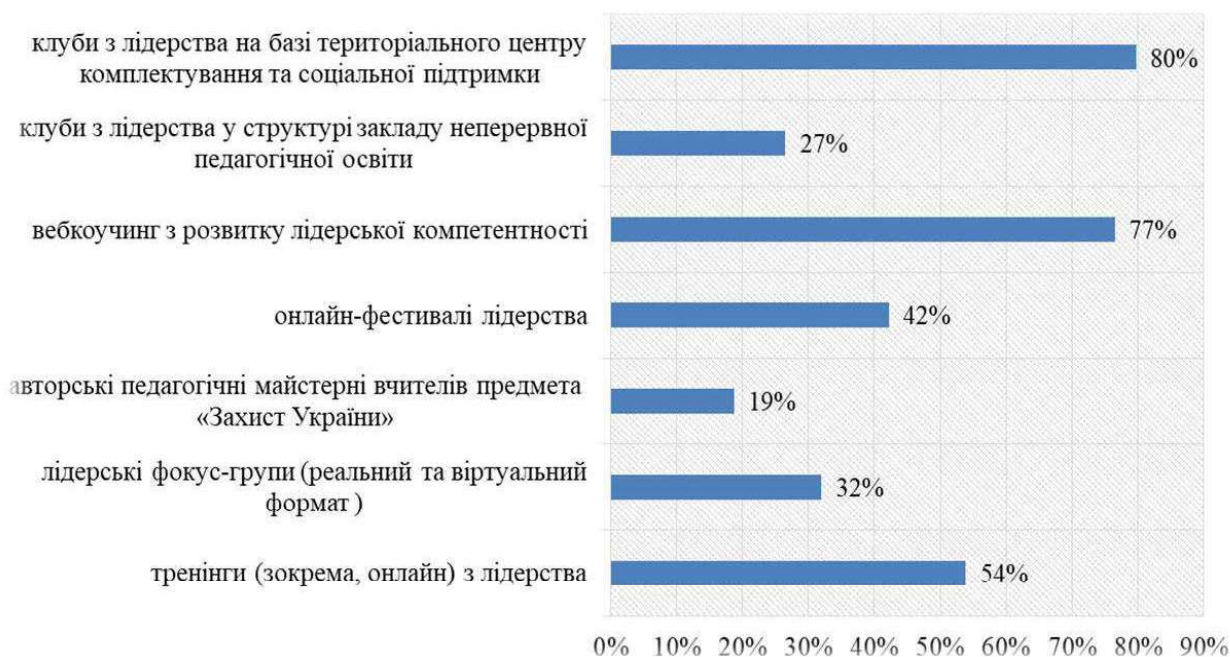
Рис. 2. Опитування щодо ефективності форм розвитку лідерської компетентності вчителів захисту України

Так, під час проведення опитування (128 учителів) респондентам пропонувалося оцінити ефективність кожної із форм роботи у контексті розвитку їх лідерської компетентності (рис. 2):