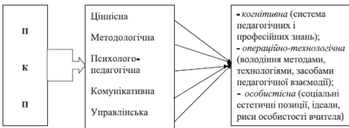
Рис. 1. Структура професійної компетентності педагога (за М. Войцехівським)

С. Толочко, працюючи над дослідженням питання модернізації компетентнісного підходу, проаналізувала структуру і моделі професійної компетентності педагога. Так, аналізуючи міркування М. Войцехівського [3], вона надає запропоновану вченим структуру професійної компетентності педагога (ПКП), до складу якої входять наступні складові: ціннісна, методологічна, психолого-педагогічна, комунікативна, управлінська, кожна з яких характеризується трьома компонентами (когнітивна, операційно-технологічна, особистісна) [14, с. 33] (рис. 1):