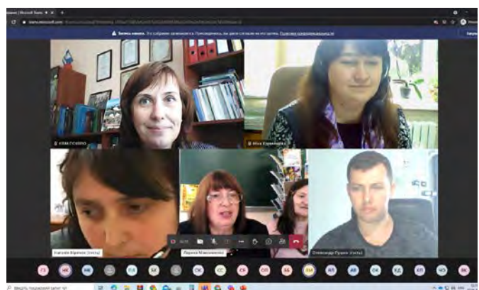
Фото 7. Вебкімната членів журі АЗПШ

Була проведена величезна робота: створено 2 вебкімнати для членів журі і учасників онлайн-конкурсу. Кожен член журі мав окремий онлайн-доступ до всіх збірок поетів і поеток до початку онлайн-конкурсу (фото 7):