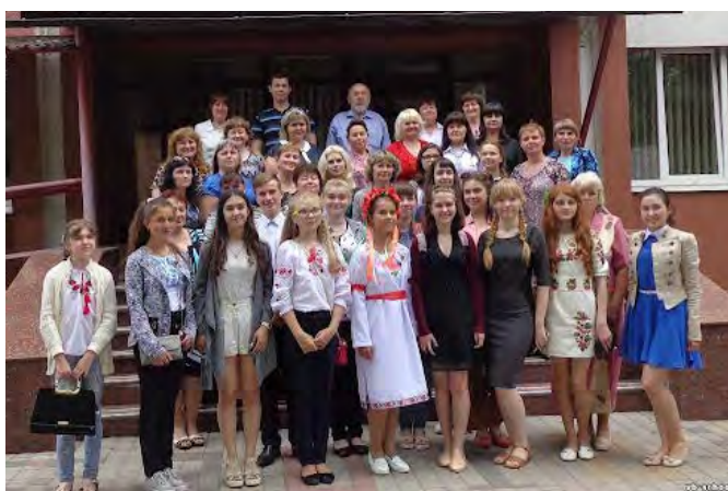
Фото 1, 2, 3. Конкурс у стінах Полтавського обласного інституту післядипломної педагогічної освіти ім. М. В. Остроградського

А потім цей захід тривалий час проводився на базі Полтавського літературно-меморіального музею В. Г. Короленка (фото 4, 5):