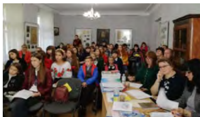
Фото 4, 5. Конкурс на базі Полтавського літературно-меморіального музею В. Г. Короленка

Кожен вірш – це сповідь юних поетів і поеток, якийсь незбутній епізод. Їхня творчість полягає в тому, щоб знайти новий, неповторний, ніким ще не випробуваний спосіб поєднання слів, який може вразити читача, знайти шлях до його душі і залишити у ній слід, змінити щось у людині назавжди. Саме про це журі, вчителі та їхні учні говорили за Короленківським чаєм, яким люб'язно пригощали господарі Полтавського літературно-меморіального музею В. Г. Короленка. Як було приємно відчувати доброту сердець наших учасників конкурсу. Тому нам, дорослим, є чому вчитися у діток!