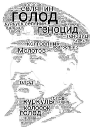
Рис. 4. Диктатор

Наприклад, 10 клас, історія України, тема «Голодомор 1932–1933 рр. Практична робота», використовуємо вправу «Диктатор» і «1933-й рік» (рис. 4, 5):