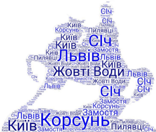
Рис. 2. Пам'ятник

го народу під проводом Б. Хмельницького), використовуючи вправу «Пам'ятник» (рис. 2):