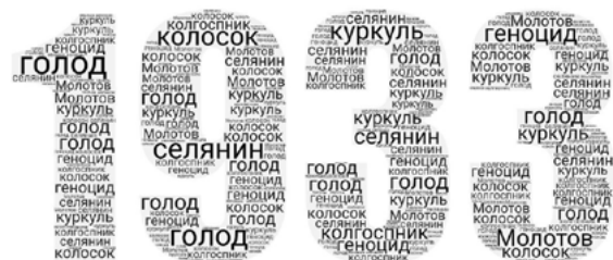
Рис. 5. 1933-й рік

Дані хмари створені учнями вдома і представлені в ході виконання практичної роботи в класі.