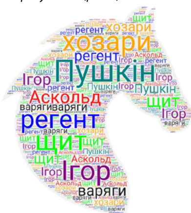
Рис. 3. Кінь

Найпоширенішим етапом уроку, де можна використовувати хмари, є етап узагальнення. Наприклад, тема «Історія України. Русь: становлення та розквіт», 7 клас, де можна застосувати вправу «Кінь» (рис. 3):